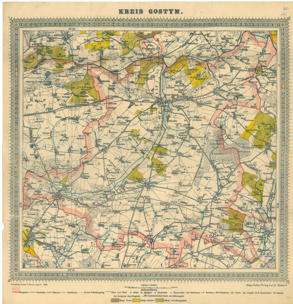
Mapa powiatu gostyńskiego z 1909 roku