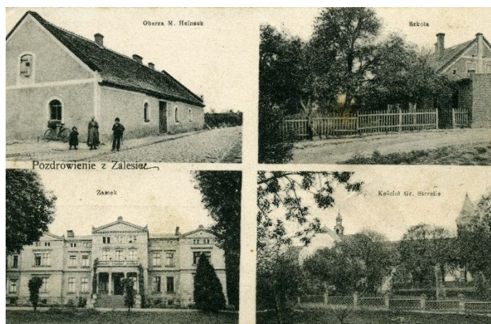
Karczma i inne ważne obiekty w Zalesiu oraz kościół parafialny w Strzelcach Wielkich – stan przed I wojną światową.