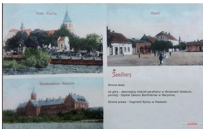
Piaski ok. 1907.