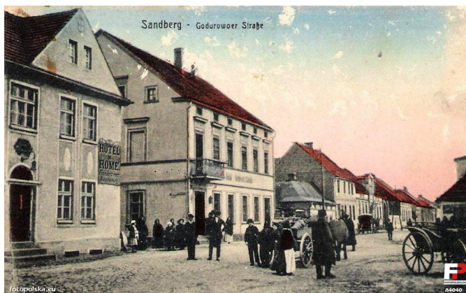
Piaski ok. 1900.

Wielkiego wysiłku ze strony Pelagii wymagało przejęcie i prowadzenie interesu po zmarłym mężu. Dziś nazwalibyśmy to prowadzeniem działalności gospodarczej. Analiza dokumentów podatkowych i innych miasta Piaski (Sandberg) z tego okresu pozwala na wysunięcie wniosku, że miejscem, gdzie prowadzono ową działalność, był obecny dom przy ul. Warszawskiej 1 na rogu z ulicą Poznańską. Ówczesnie, czyli z czasów dzierżawy przez Koteckich, własność Niemca Rudolfa Langnera (1862-1925) 116 . Ostatecznie potwierdza to fotografia budynku z dumnie brzmiącym napisem na elewacji pomiędzy parterem a pierwszym piętrem: Hotel Victoria R. Kotecki 117 . Pelagia Kotecka figuruje w zestawieniach podatkowych włącznie do 1919 roku 118 . Z faktów tych wynika, że przeprowadzka do Ostrowa nastąpiła prawdopodobnie w 1920 roku, ewentualnie tuż przed zakończeniem 1919 roku. Dlaczego Pelagia podjęła decyzję o wyprowadzce z Piasków? Miejscowość tę po wojnie opuszczali Niemcy i Żydzi z przyczyn politycznych i ekonomicznych oraz niektórzy Polacy z nowymi pomysłami na ułożenie sobie życia w innych lokalizacjach. Do nich zaliczała się Pelagia Kotecka. Liczba mieszkańców w Piaskach po dwóch latach od zakończenia wojny zwiększyła się (w 1921 roku Piaski liczyły 1653 mieszkańców) na skutek powrotu z Niemiec polskich reemigrantów i przyrostu naturalnego 119 oraz osiedlania się tam mieszkańców pobliskich miejscowości i chociażby nauczycieli z innych regionów Polski 120 .