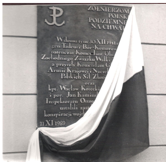
Odsłonięcie tablicy pamiątkowej. Rok 1989.

Nie zapominamy też o kobietach – żonach, matkach czy córkach. Kiedy ich mężowie i ojcowie walczyli, byli pozbawieni wolności czy tracili życie – to na nich spoczywał ciężar okupacyjnych dni, obowiązek utrzymania rodziny. Dziękujemy!