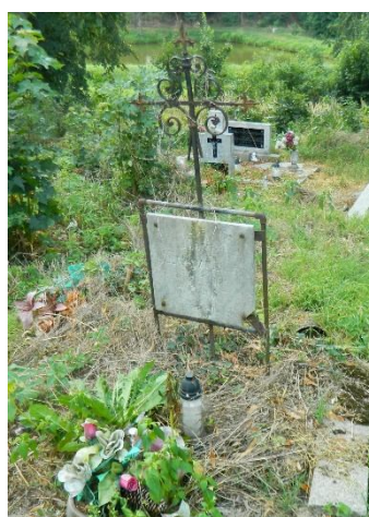
Nagrobek Marii Bialeckiej z Sierszulskich.