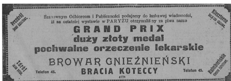
Gazeta „Lech” 1927, nr 267

z zawyżaniem stopnia ubytków naturalnych (ustawowo dopuszczalne było 20%, a wykazywano 23-24%) przy okazji zwrotów piwa ze sprzedaży rozwożnej. W rezultacie dopiero w połowie 1935 roku Sąd w Gnieźnie orzekł bezpodstawność zarzutów i uwolnił wszystkie osoby od winy i kary, a chodziło o niebagatelną kwotę 67 000 złotych 159 . Jaki był powód wszczęcia kontroli w browarze, nie wiadomo. Może konkurencja podpowiedziała, może normalna procedura kontrolna, może rozpoczynający się konflikt właścicieli i pozostałych dwóch braci dotyczący zarządzania i podziału majątku browaru? Nieporozumienia przybrały wymiar sądowy o charakterze cywilnym i karnym, a w aspekcie międzyludzkim psychiczny i fizyczny, szczególnie w 1936 roku 160 . W końcu pod presją sądu wyznaczony został jako „wyłączny zawiadowca i kierownik firmy” inż. Stefan Głowacki 161 . Rodzina była skonfliktowana, dla matki Pelagii nie była to przyjemna sytuacja – musiała brać udział w rodzinnej rozprawie sądowej. Na ile ówczesne wiadomości na ten temat podawane przez prasę żądną sensacji w celu zwiększenia nakładu były z kategorii fake newsów, na ile prawdą, nie wiadomo. Sąd Okręgowy w Gnieźnie stanął po stronie Jana Koteckiego. Kary pozbawienia wolności dla trzech braci Sąd zawiesił warunkowo na okres półtora roku. Orzeczono też utratę praw obywatelskich i publicznych na okres dwóch lat 162 . Przez następne lata, aż do wybuchu wojny, browar działał, ale prasa przestała się szczególnie jego losem zajmować.