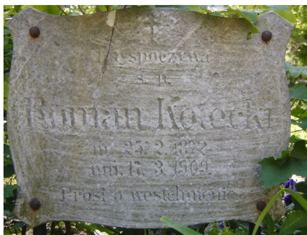
Inskrypcja nagrobna (Roman Kotecki) w powiększeniu.