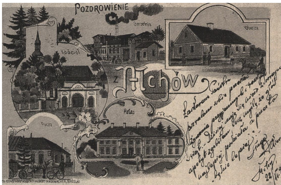
Mchy – oberża i inne budowle (przed 1899 rokiem).