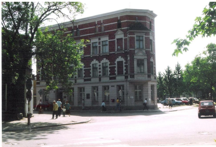
Stan w 1992 roku.