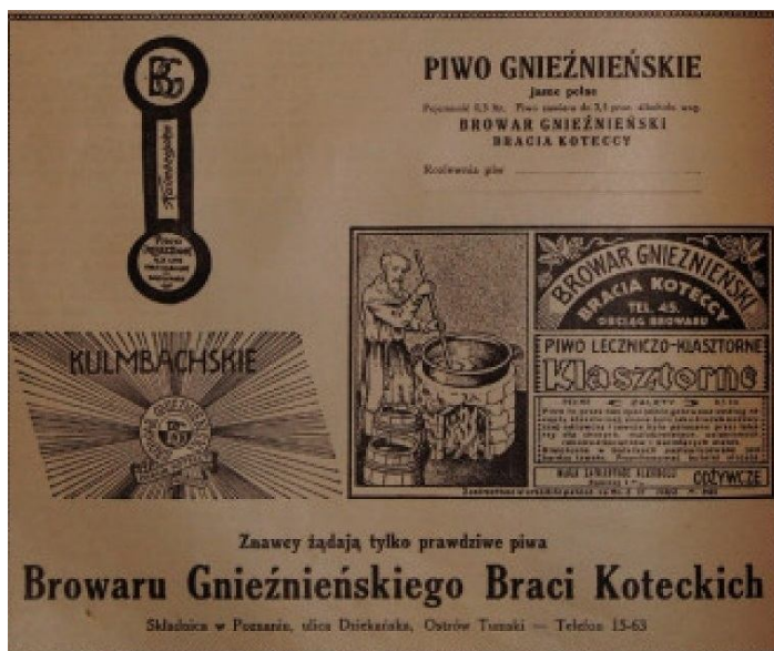
„Wielkopolska Ilustracja” 1930, nr 30

Przed tymi wydarzeniami, 17 września 1932 roku kapitan w stanie spoczynku Waclaw Kotecki został odznaczony Krzyżem Niepodległości przez Prezydenta Rzeczypospolitej za czyny bojowe położone na polu walki 163 . Pod koniec 1937 roku zwrócił się do Kapituły Krzyża i Medalu