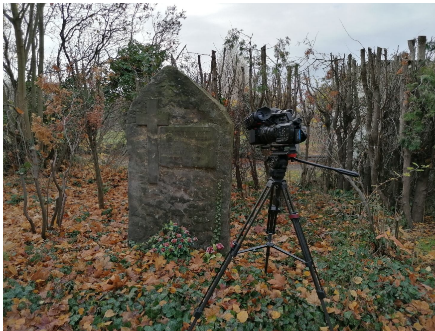
Okiem kamery: Gedenkstein – kamień pamiątkowy.