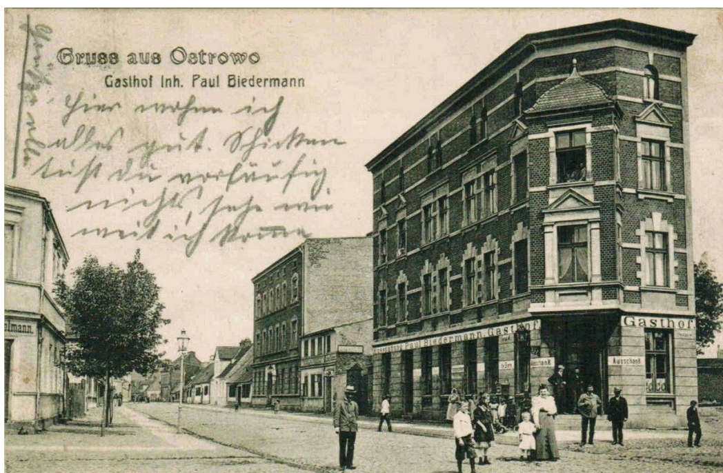
Kamienica przy ul. Zdunowskiej 25 – ok. 1910 roku.

A więc Ostrów! Dziesięciokrotnie większy pod względem liczby mieszkańców, z szansą na rozwój przemysłu, stwarzał znacznie lepsze możliwości rozwoju ekonomicznego niż niewielkie Piaski. Z punktu widzenia lat 20. i 30. XX wieku na pewno tak, pomimo zaistniałych w Polsce trudności gospodarczych, w tym również w Ostrowie 121 . Czy tylko takim powodem kierowała się Pelagia Kotecka, osiedlając się tutaj z rodziną? Z książki adresowej dowiadujemy się, że wdowa „Kotecka Pelagia” mieszkała przy ul. Zdunowskiej 25. Była właścicielką domu. Pod tym samym numerem znajdowała się też restauracja 122 .