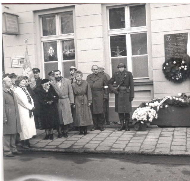
Chwila zadumy – 11 listopada 1989 r.