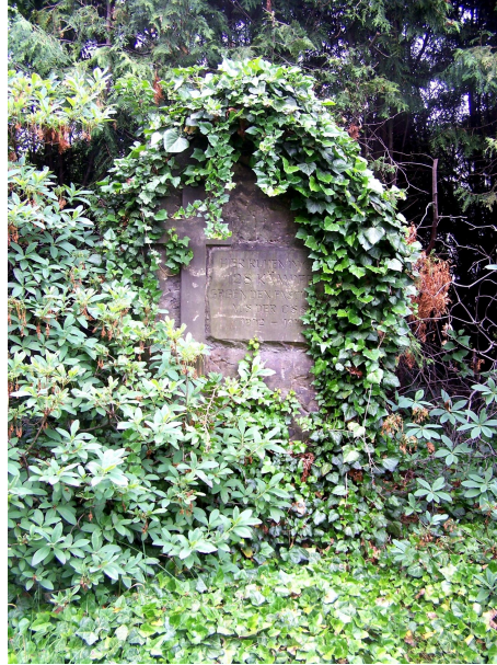
Dresden Neuer Katholischer Friedhof – Gedenkstätte 128 Kämpfer – Drezno Nowy Cmentarz Katolicki – pomnik 128 bojowników.

sem: „Tu spoczywa 128 [obecnie w opisie cmentarza 129] bojowników przeciwko faszyzmowi z CSSR. 1942-1945” 219 ?