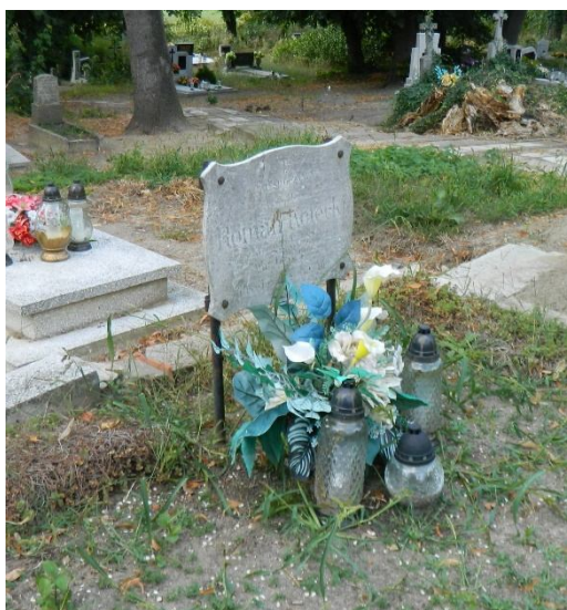
Nagrobek Romana Koteckiego. Strzelce Wielkie.

z nich w wieku 83 lat w maju, a druga – mając 30 lat w listopadzie 1917 roku 68 . Wszystkie trzy osoby zmarłe w Piaskach zostały pochowane na cmentarzu parafialnym przy kościele w Strzelcach Wielkich 69 .