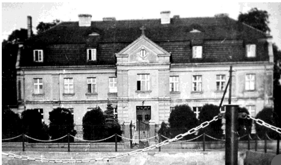
Pałac w Chumiętkach w dwudziestoleciu międzywojennym

14 września 1922 roku resztówkę Chumiętki nabyło od miasta Krobi Zgromadzenie Misjonarzy Oblatów Maryi Niepokalanej i przenieśli z Krotoszyna swój klasztor. Utworzono tu pierwotnie Wyższe Seminarium Oblatów. Poświęcenie nowego miejsca odbyło się 26 lipca 1923 roku. Ponieważ juniorat w Lublińcu był zbyt liczny, przeniesiono jedną klasę do Chumiętek, a po przeniesieniu scholastykatu do dawnego klasztoru w Obrze urządzono tu wyłącznie juniorat. W Chumiętkach znajdowała się też redakcja miesięcznika „Oblat Niepokalanej”. W 1938 roku było tu trzech ojców.