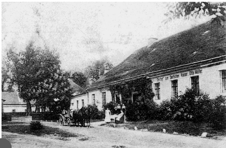
Oberża działająca na przełomie XIX i XX wieku

W latach osiemdziesiątych XIX wieku dobra rycerskie Chumiętki wraz z folwarkami Ludwikowo i Żychlewo należały do Adolfa Schatza, oficera armii pruskiej w stanie spoczynku, a następnie do jego spadkobierców. W 1880 roku na terenie folwarku znajdowało się 10 domów, w których mieszkało 139 osób. W 1881 roku powierzchnia całkowita dóbr Chumiętki wynosiła 276 ha, w tym 202 ha pól, 67 ha łąk, 6,5 ha lasów. Gospodarstwo specjalizowało się w hodowli bydła rasy holenderskiej. Ponadto hodowano owce rasy Negretti.