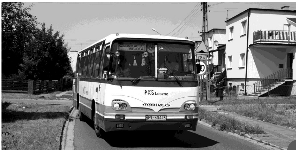
Autobus marki Autosan H9-21 w obsłudze komunikacji miejskiej na ulicy Podleśnej (12 czerwca 2007 roku)

Wzrastająca frekwencja w kolejnych tygodniach sprawiła, że PKS Leszno postanowiła uruchomić 1 listopada 2002 roku dodatkową linię dla mieszkańców chcących dotrzeć na cmentarz. Jej trasa rozpoczynała się na dworcu autobusowym i prowadziła przez przystanki przy: Fabrycznej (rożeń), Poznańskiej, skrzyżowaniu z drogą do Dusiny, Mickiewicza, Sportowej, 27 Stycznia, Granicznej, Starogostyńskiej, dworcu, Parkowej, Łokietka, Spokojnej, Strzeleckiej, Wrocławskiej, Energetyka i Rynku do cmentarza i dalej na Świętą Górę, gdzie był postój. Sprzed bazyliki dwa autobusy odjeżdżały w godzinach od 9.00 do 17.00 z częstotliwością około 30-60 minut, pokonując analogiczną trasę w drodze powrotnej. Przejazd zajmował 44 minuty 5 . Linia ta spotkała się z bardzo dużym zainteresowaniem mieszkańców i była uruchamiana co roku 6 .