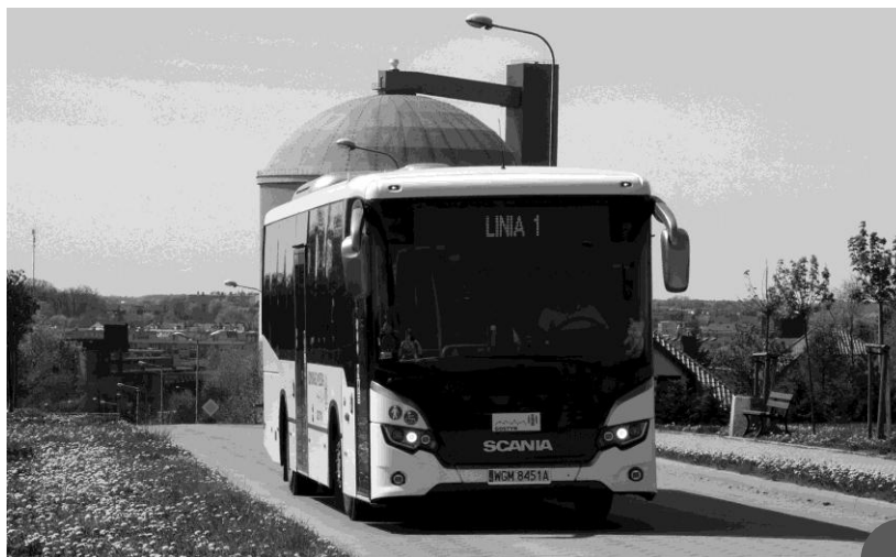
Niskowejściowy autobus Scania CK360UB firmy Markpol na linii nr 1 na ulicy Czereśniowej, 29.04.2022.

spotkać można było jedynie w godzinach szczytu, a poza szczytem jedynie w dni targowe – we wtorki i piątki. Na przystankach umieszczone zostały tabliczki z nowym rozkładem jazdy. Aby sprawdzić godziny odjazdu autobusów z każdego przystanku, można było również skorzystać z uruchomionej kilka miesięcy wcześniej aplikacji mobilnej kiedyprzyjedzie.pl .