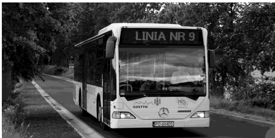
PKS Poznań w obsłudze linii 9 w drodze z Bazyliki do centrum Gostynia, 22.07.2016

podłogowe autobusy marki Mercedes-Benz O530 17 . Przed włączeniem do ruchu zostały one pomalowane w białopomarańczowe barwy.