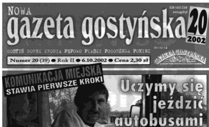
Informacja o uruchomieniu komunikacji miejskiej zamieszczona została na okładce „Nowej Gazety Gostyńskiej” 2002, nr 20

Przygotowania do otwarcia komunikacji miejskiej w Gostyniu trwały od końca 2001 roku 1 , choć potrzebę uruchomienia sprawnego miejskiego transportu dostrzegano już wcześniej. Po wielu miesiącach przygotowano w czerwcu 2002 roku Państwowa Komunikacja Samochodowa w Lesznie przedłożyła władzom miasta projekt rozkładu jazdy, który po analizie został zaakceptowany. Uruchomienie komunikacji miejskiej w Gostyniu nastąpiło wraz z końcem wakacji, 1 września 2002 roku 2 .