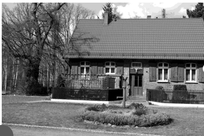
Leśniczówka Miranowo zbudowana w 1890 roku (2022)