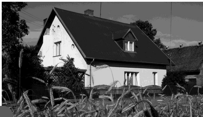
Leśniczówka Dębno zbudowana w 1890 roku (2005)