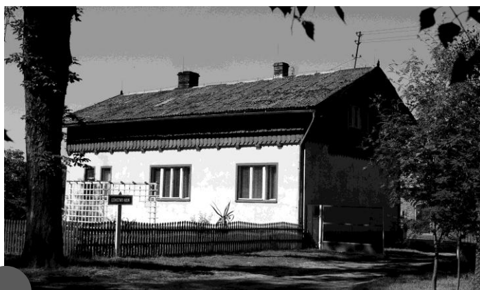
Leśniczówka Halin zbudowana w 1857 roku (2005)