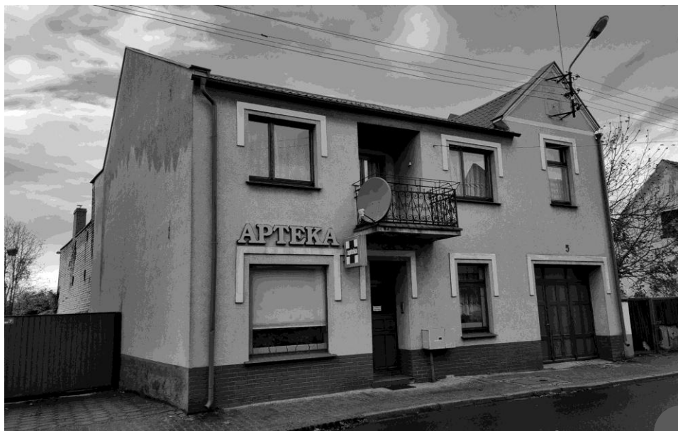
Ulica Kotkowiaka. Przed 1912 rokiem, zanim powstał widoczny na zdjęciu budynek, znajdował się tu żydowski dom modlitewny

Do 1939 roku Pogorzelę opuścili pozostali już nieliczni wyznawcy judaizmu.