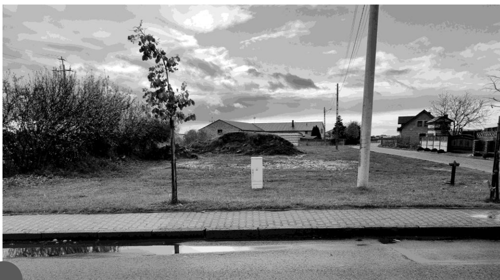
U zbiegu ulicy Boreckiej i Szarych Szeregów znajdował się cmentarz dla wspólnoty Żydów w Pogorzeli. W okresie okupacji zniszczyli go Niemcy. Macewy wykorzystano w trakcie przebudowy elektrowni w Pogorzeli w 1943 roku

W mieście znajdował się żydowski dom modlitewny (bożnica) wybudowany w 1846 roku. Wzniesiono go niedaleko Rynku, na ulicy Koźmińskiej (dzisiejsza ulica Kotkowiaka). Był on darem od ówczesnego właściciela miasta Feliksa Taczanowskiego. Do 1912 roku w obiekcie odprawiano nabożeństwa, jednak po drastycznym spadku liczebności żydowskich mieszkańców gminy bożnicę sprzedano i następnie zburzono. Na jej miejscu wybudowano nowy obiekt, w którym do 2023 roku mieściła się apteka. Tutejsza wspólnota posiadała także własny cmentarz. Mieścił się on za miastem, u zbiegu ulicy Boreckiej i Szarych Szeregów. Pierwsza wzmianka o miejscu spoczynku dla Żydów pochodzi z 1889 roku. Wiadomo jednak, że przed powstaniem tego miejsca pochówku Żydów z Pogorzeli grzebano w Borku.